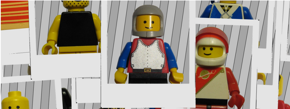
03 série lego

Plages électroniques / Cannes / Juillet 2009 / Vj set