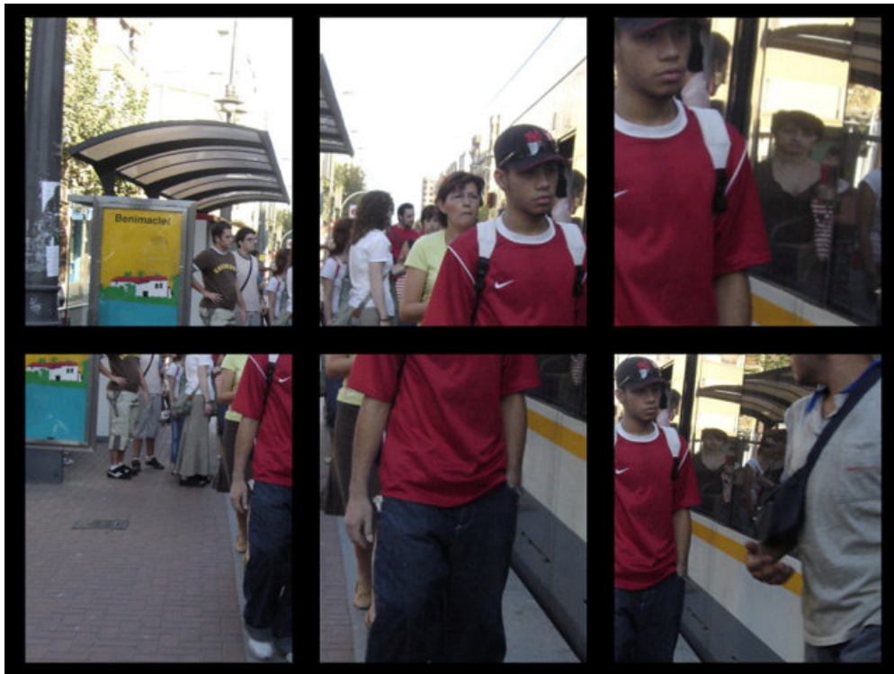
01 fragment urbain