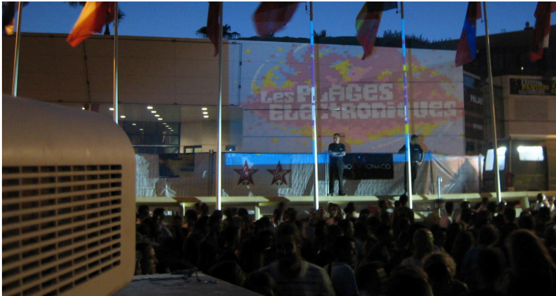
08 plages électroniques